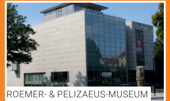
ROEMER- & PELIZAEUS-MUSEUM