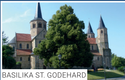
BASILIKA ST. GODEHARD